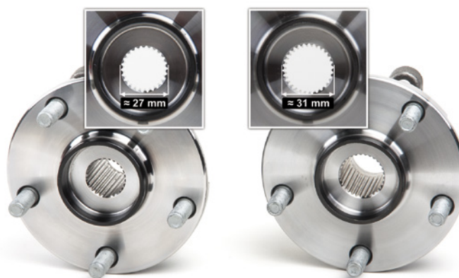
Figura 2: Il diametro del profilo del semiassse è diverso.

Per le vetture riportate in precedenza sono disponibili due diversi set di cuscinetti ruota FAG. I due cuscinetti ruota sono quasi identici e si differenziano a seconda del diametro del profilo del semiassse che si innesta nel mozzo ruota.